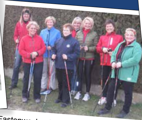
Fastenwoche der Gesunden Gemeinde