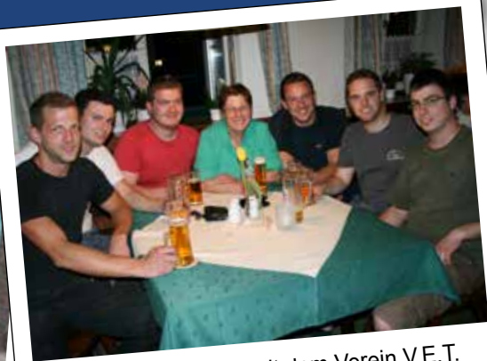
Maibaum-Auslöse mit dem Verein V.E.T.