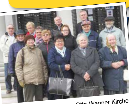
Bildungsfahrt KBW Ollern: Otto-Wagner Kirche