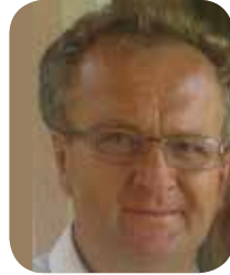
Manfred Hack Rechte Bachg. 1/2