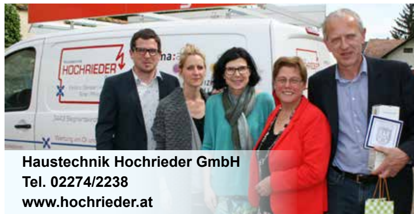
Haustechnik Hochrieder GmbH Tel. 02274/2238 www.hochrieder.at